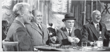
One, Two, Three / Billy Wilder / 1961

کمیسر بریچیکف (لئون آسکین، رئیس کمیسیون تجاری شوروی در برلین شرقی): اگه شما امریکایی‌ها عمو سام رو توی په ساعت کوکو گذاشتین اصلاً مهم نیست، ما په فزانورد روس به ماه می فرستیم! مک نامارا (جیمز کائگی،