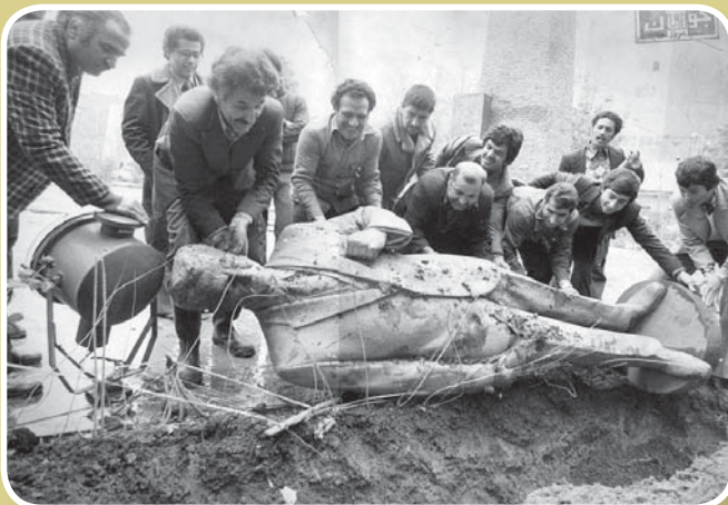
بت شکن که آمد، ابراهیمیان، به ندای ابراهیم زمان پاسخ دادند و بت های جهل و نادانی را یکی پس از دیگری سرتگون کردند.

امروز صبح خورشید بار دیگر طلوع کرد. همه جا را نور باران کرد. امروز روز تاریخساز ملت قهرمان ایران است. امروز لبها از خنده شکوفا شده است. امروز روز ۱۲ بهمن ماه است. بهمن ماه سال ۱۳۵۷.