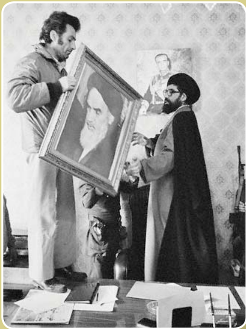
دیو چو بیرون رود، فرشته در آید.