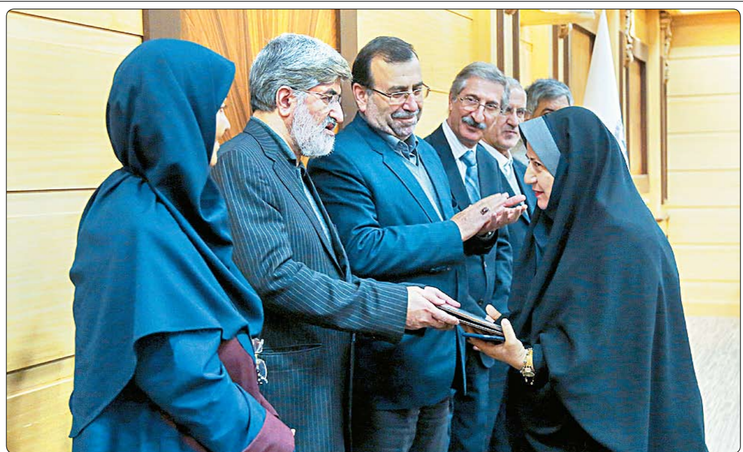
اندا جایزه روز ملی کیفیت توسط خانم پیروزبخت رئیس سازمان ملی استاندارد

هیچ منافاتی با قانون و شرع ندارد که بخشی از استادیوم ورزشی به بانوان اختصاص یابد