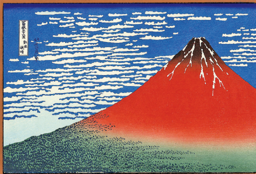
«فوجی سرخ» از مجموعه ۴۶ تایی ها

شما می توانید با اسکن این بار کد اثری را که میراثک انتخاب کرده و در موزه متروپولیتن نیویورک نگهداری می شود با وضوح و کیفیت بهتری تماشا کنید