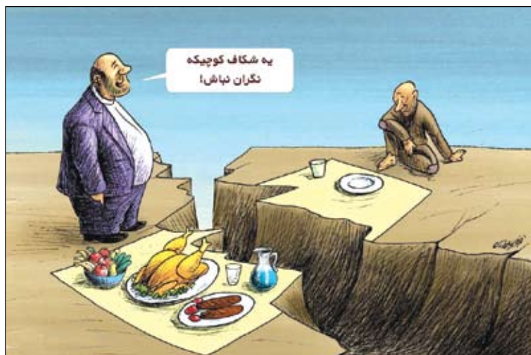
شکاف طبقاتی بیشتر می شود