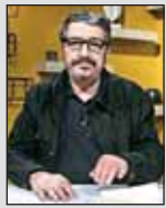
دلنوشته های آهان آهان دار محبوب صالح علا